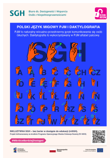
rys. 2. Przykład kampanii informacyjnej nt. komunikacji - inSGH

kiej wprowadza również innowacje tj. system nawigacyjno-informacyjny, plany tyflograficzne, pętle indukcyjne, czy tłumacz polskiego języka migowego (on-line). InSGH likwiduje również bariery architektoniczne oraz zwiększa dostępność procesu kształcenia poprzez np. tłumacza PJM podczas Dni Otwartych, dostosowane zajęcia sportowe, czy wyrównawcze zajęcia z języków obcych. Oprócz powyższych inSGH stawia również na zwiększanie świadomości, kształtowanie postaw i podnoszenie kompetencji m.in. poprzez organizację różnego rodzaju szkoleń, czy podcastów.